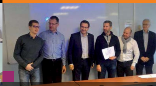
AEROμTECH développe la Performance Industrielle des entreprises de Bourgogne-Franche-Comté